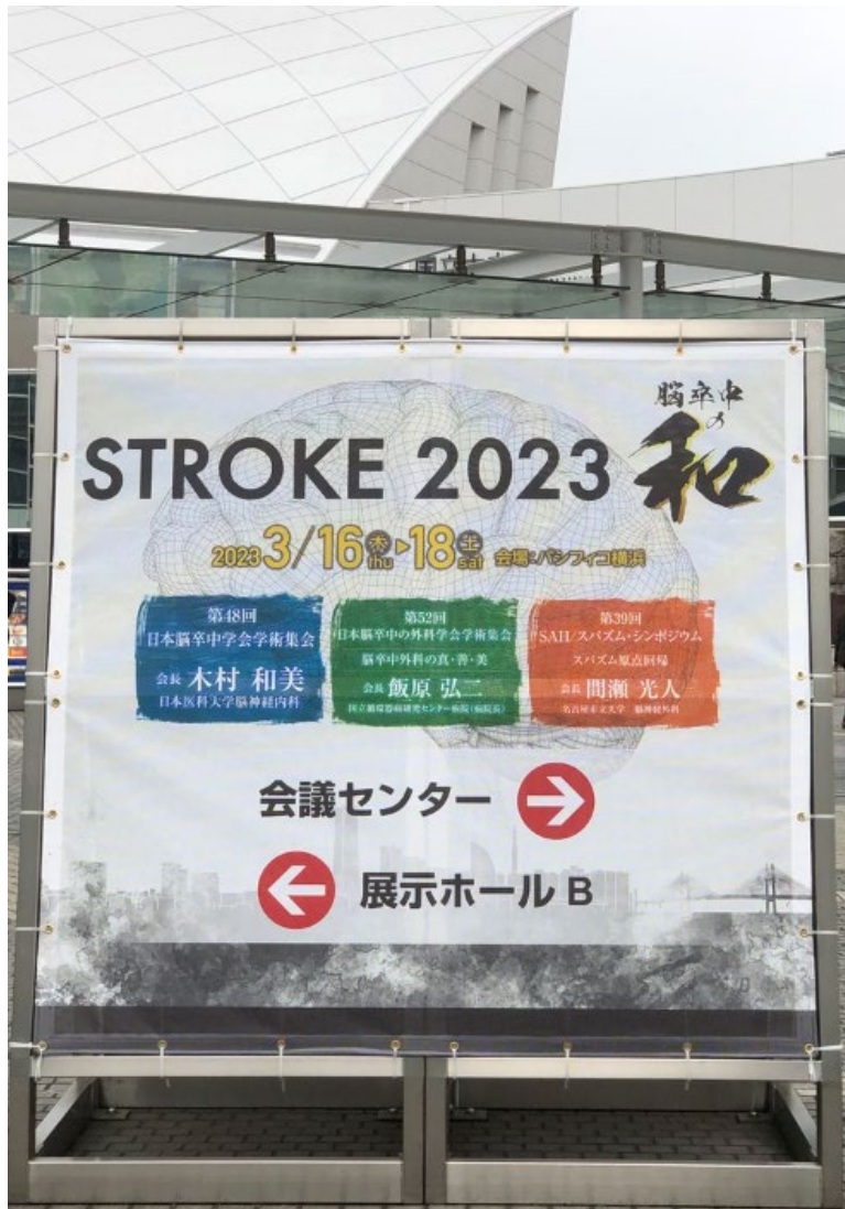
会場：パシフィコ横浜